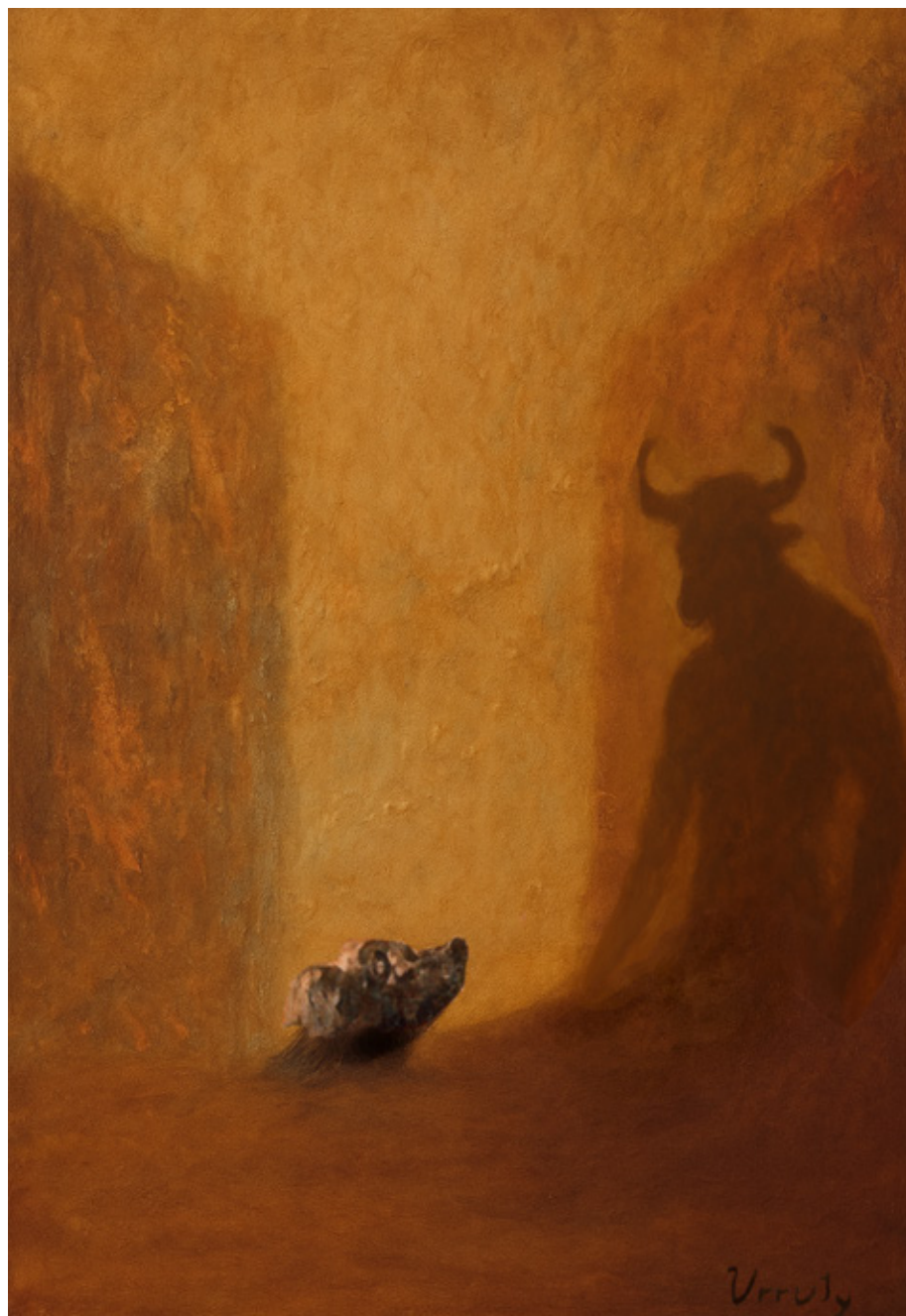
Diego Urruty Acrílico sobre lienzo