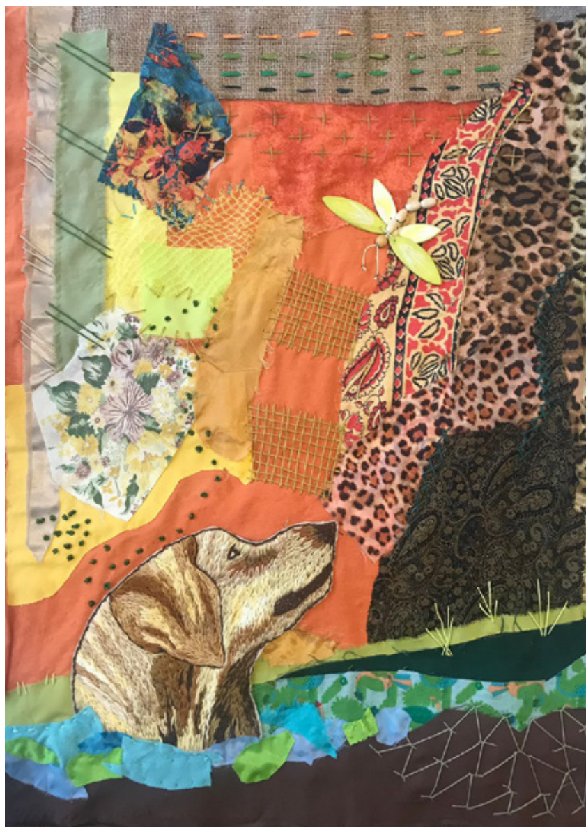
Beatriz Romano Tapiz collage textil