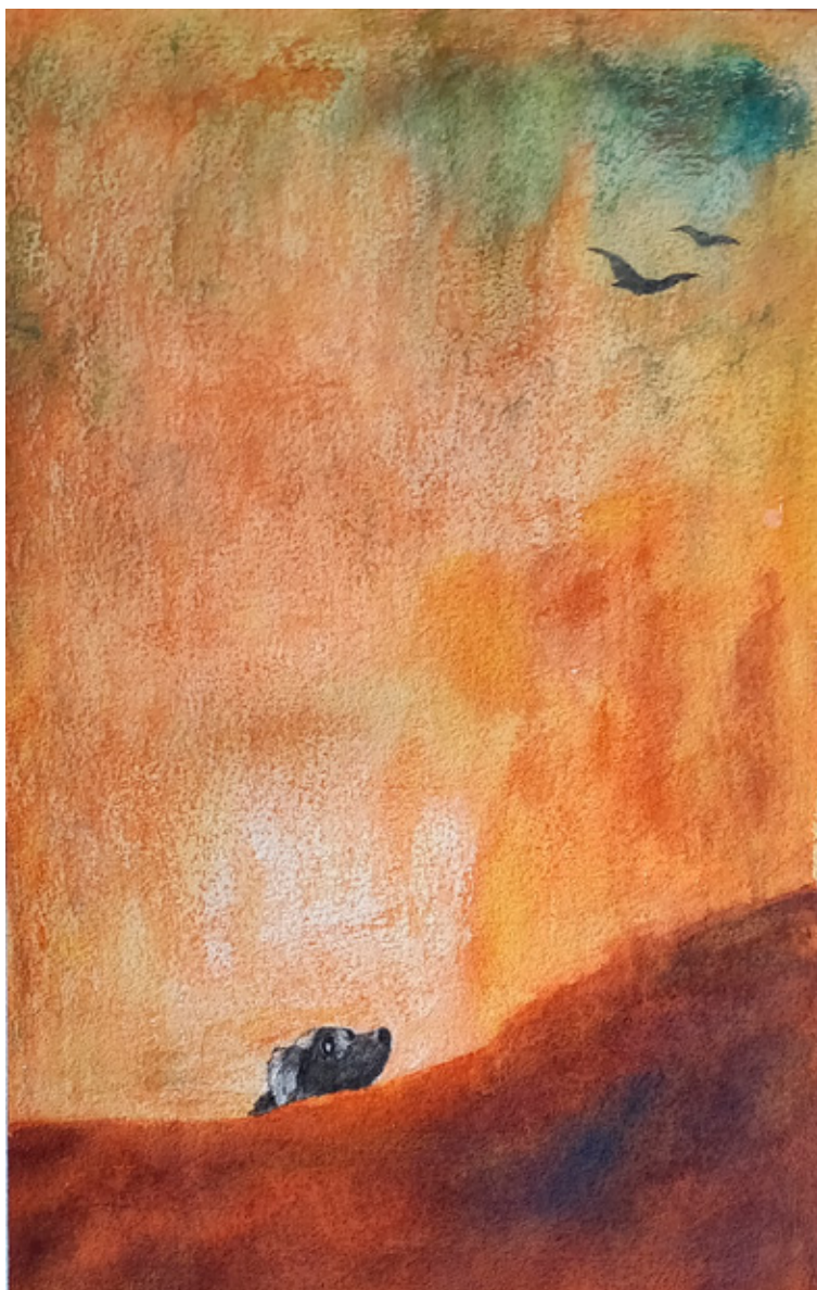
Perla León Acuarela