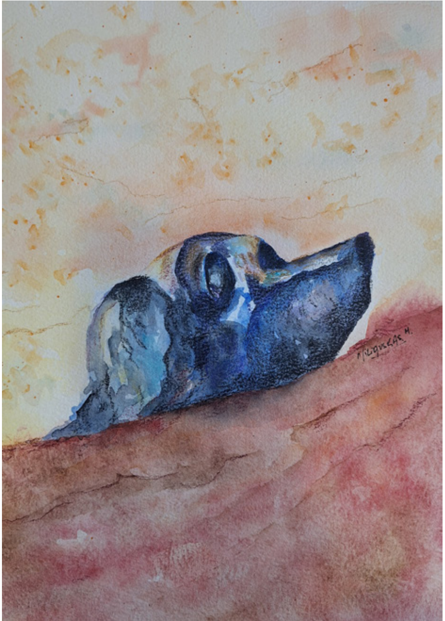
Mónica Miliauskas Acuarela y lápices acuarelables